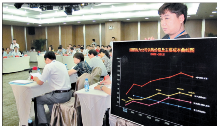
成本示意图 在听证会上，有关方面展示了供热

昨日，我市城市居民供暖价格改革调整听证会在航空城酒店举行。在长达3个多小时的听证会上，22名听证参加人围绕市价格主管部门提出的我市城市居民供暖价格两个调价方案，对我市居民供暖价格调整的的必要性和可行性进行了讨论，并提出了许多建设性意见。