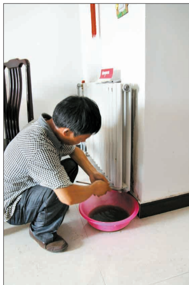
工作人员维修暖气片

热力公司相关负责人称,为了确保住户的财产不受损失,在试水当天,家里有人的开始试水,没人的不进行试水,等随后再次进行集中试水。接下来将要试水的小区业主要关注物业通知,在试水期间,家里一定要留人,发现问题现场解决。