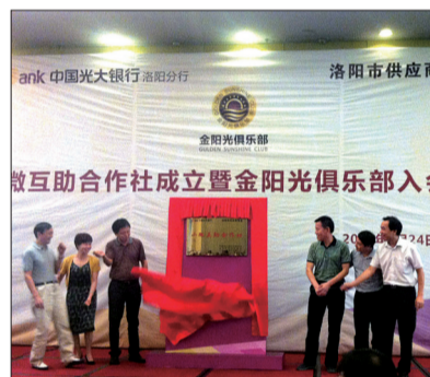
小微互助合作社揭牌仪式现场