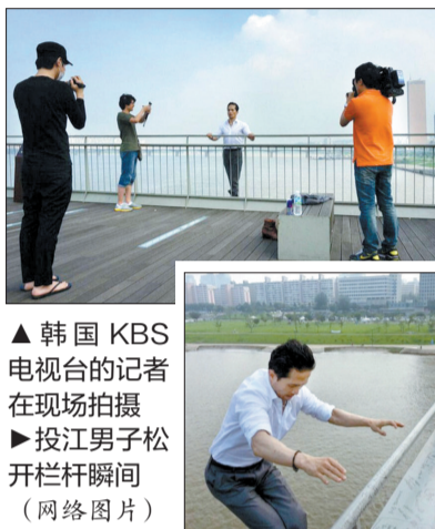
▲韩国 KBS 电视台的记者 在现场拍摄 ▶投江男子松 开栏杆瞬间