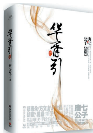
作者:唐七公子 出版社:湖南文艺出版社

早些年,有《泡沫之夏》《来不及说我爱你》《佳期如梦》等多部改编自网络小说的电视剧。到了近几年,《步步惊心》《宫》《那些年我们一起追过的女孩》《失恋三十三天》《甄嬛传》等网络小说呈现井喷态势,可见影视剧制片人向网络小说作者购买版权已成为一种大的行业趋势。