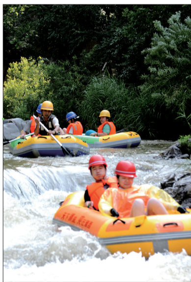
激情漂流 (资料图片)