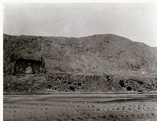
20世纪20年代的龙门石窟