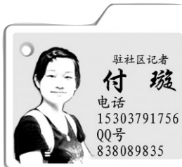
负责片区：洛龙区、高新区