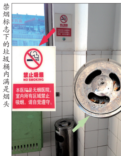
禁烟标志下的垃圾桶内满是烟头