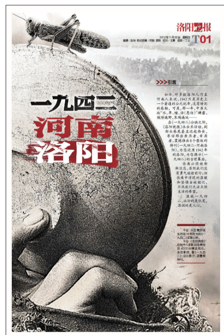
本报《一九四二·河南洛阳》特刊版样

如今这组照片,是那段历史更为真实的再现。之所以重温这段历史,是因为洛阳人在这场灾难中遭遇的苦难、迸发的勇气,都不应被忘记,唯有如此,我们才能坚定前行。