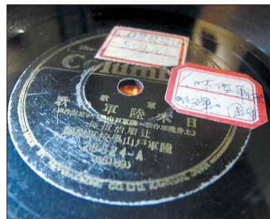
这张唱片是日军侵华的铁证