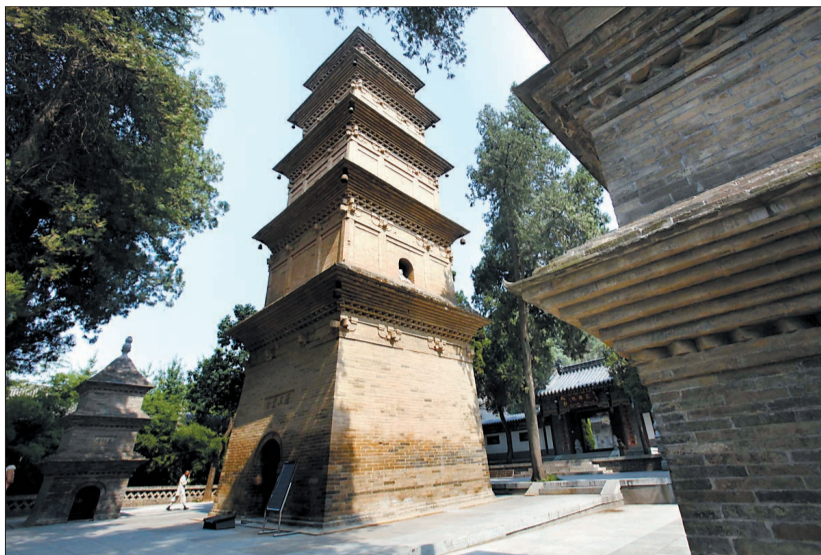
在玄奘塔(中)两边,分别“侍立”着窥基塔和圆测塔