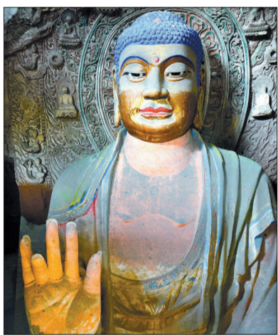
丝路商旅见到这尊大佛便知长安已近