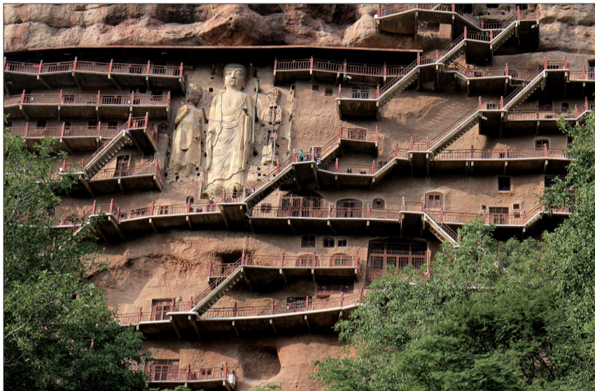
麦积山石窟石壁上的佛龕及造像

和咱洛阳的龙门石窟以及甘肃的敦煌莫高窟、山西的云冈石窟并称为中国四大石窟的麦积山石窟,到底有着怎样的色彩?在绚丽多姿的丝绸之路上,它又占据着怎样的地位?