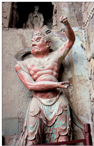
麦积山石窟内彩绘力士造像肤色所用颜料与洛阳三彩釉料中的红丹一致

目前,麦积山石窟现有编号的佛龕221个,保存了历史上各个时期不同风格特点的各类雕塑7800余座,壁画1000多平方米。由于历代雕塑技法高超、形神兼备,具有极高的艺术审美价值和研究价值,被现今许多专家、学者誉为“东方雕塑博物馆”。