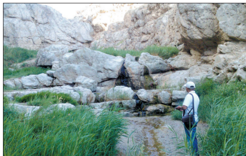
正是这悬泉,让此处留下无数历史遗迹