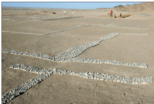
石子勾勒出古人在此留下的印记