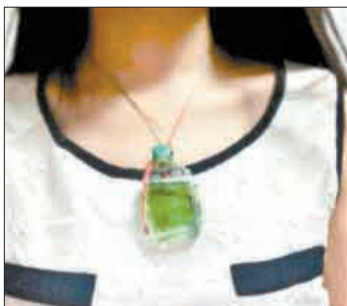
「风油精」祖母绿项链