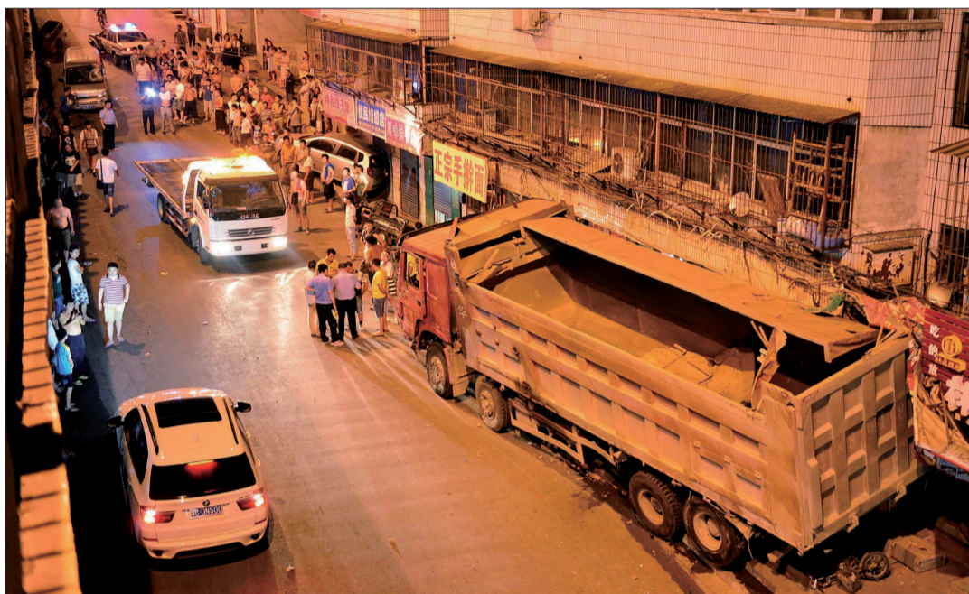
车祸现场(受损宝马车已驶离原位置)

另有目击者称,货车是从桥下交警部门设置的事故车辆停车场驶出的,上坡时突然下滑疑为刹车出现故障。