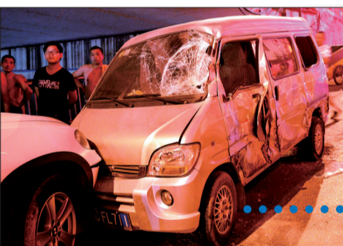
五菱面包车受损严重