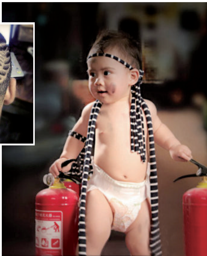
→消防安全 要从娃娃抓起