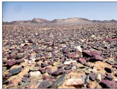
车队离罗布泊越来越远