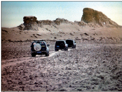
在罗布泊行进中经过白龙堆雅丹地貌

信息几乎在强调同一个信息：热！罗布泊白天的温度几乎超过50℃，而北线队员看看自己的温度计，最热时也没有超过30℃！天山南北，被分割成冷热不均的两个世界。