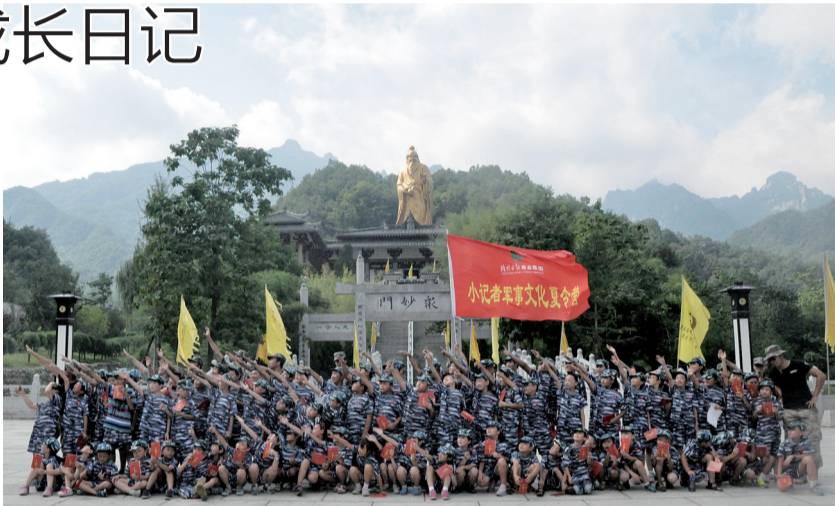
小记者夏令营,明年见