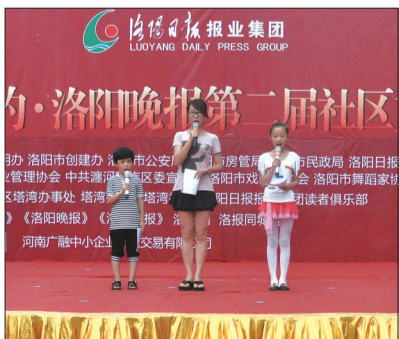
口才班学员和老师同台主持大型活动

近期,小记者俱乐部的电话不断响起,不少小记者家长来电分享孩子的点滴成长。“孩子上小记者口才班已