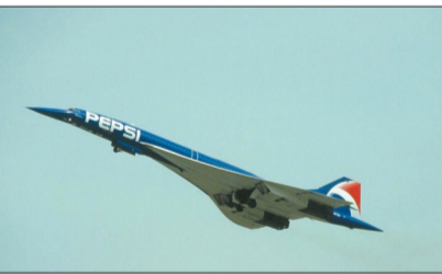
协和式超音速客机