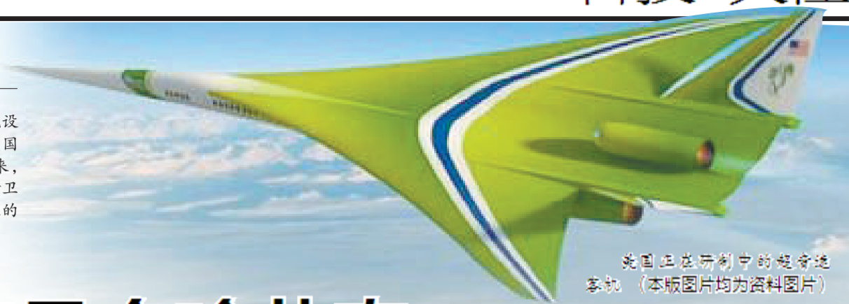
美国正在研制中的超音速客机 (本版图片均为资料图片)

近日,美国亿万富翁艾伦·马斯克设计出超音速的“超级高铁”,日本和美国也分别在开发新的超音速客机。未来,超音速飞行器甚至可以代替火箭发射卫星。人类即将进入超音速时代,未来的出行将更快捷。