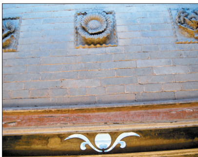
老宅正门上的砖雕