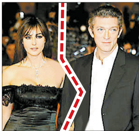
莫妮卡·贝鲁奇与文森·卡索

1999年，恋爱3年的他们携手走进婚姻殿堂，并先后生育了两个女儿，分别是8岁的黛娃和3岁的莱奥尼。据说，这对长期以来羨煞旁人的模范夫妻之所以会分道扬镳，主要是因为聚少离多的分居生活，贝鲁奇常年在罗马居住，而卡索大部分时间都在巴西。