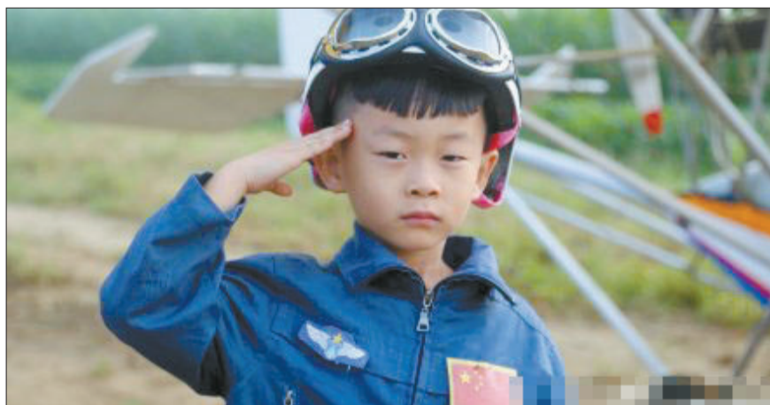
起飞前，多多向大家敬礼