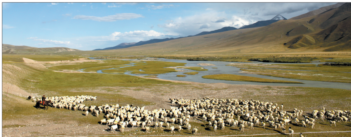
(序号0347)风吹草低见牛羊