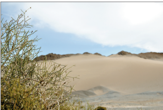
(序号0332)罗布泊大沙山