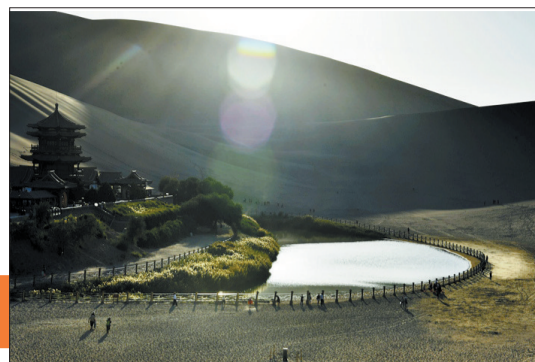
(序号0337)月牙泉沐浴阳光