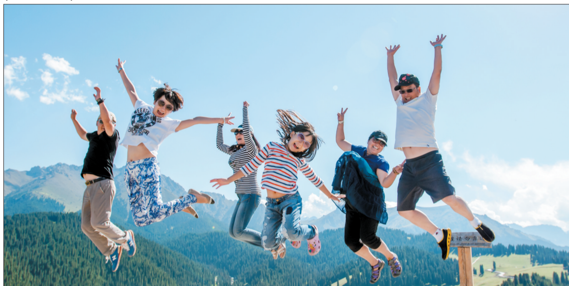
(序号0343)跃舞天山 定格瞬间