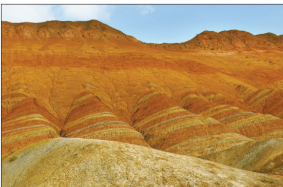
(序号0311)七彩丹霞 绝色天下