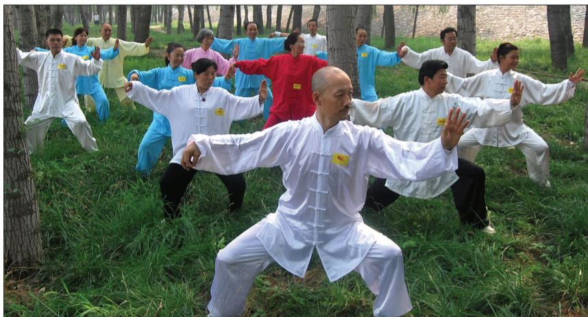
骑点带领大家练太极拳

回到家,骑点就琢磨开了:太极拳这项运动男女老少皆宜,靠自己扎实的底子(他有国家等级裁判证书,在洛阳的一些比赛中也担任过武术裁判),一定能带领大伙儿习武强身。有了这个想法,他就开始找场地。找到场地后,他就领着大家练开了。