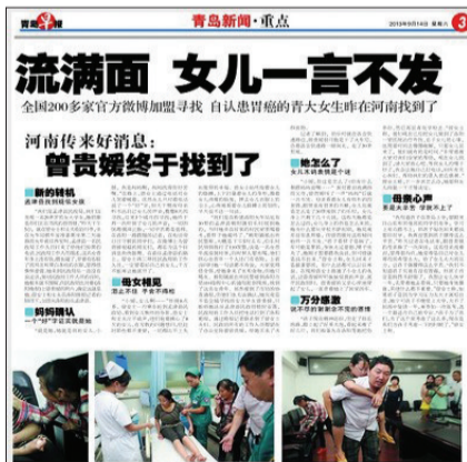
《青岛早报》的相关报道 (网络截图)