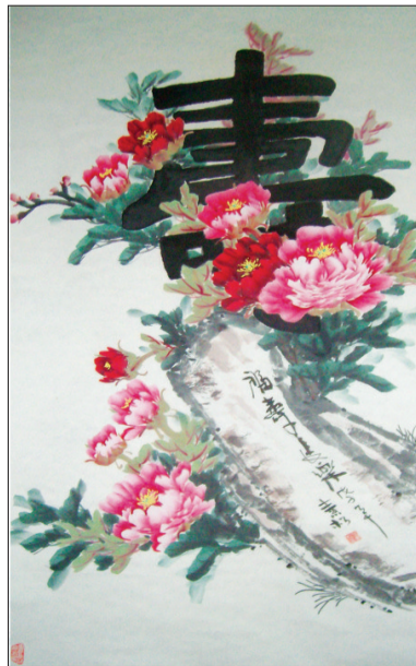
张素松(女) 67岁 洛龙区