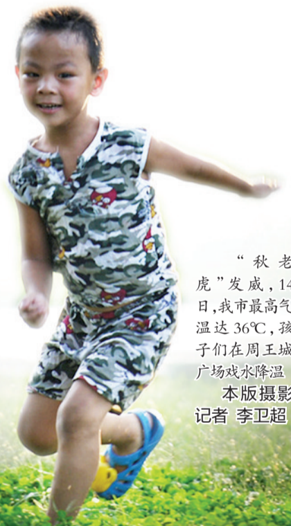
“秋老虎”发威,14日,我市最高气温达36℃,孩子们在周王城广场戏水降温