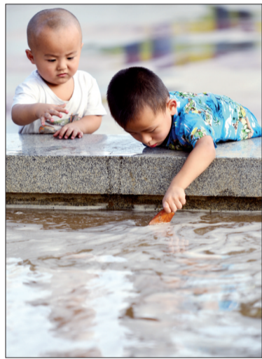
□记者 杨凤轩 通讯员 吴文华

“周六晚上风挺大的啊,以为今天天儿肯定特别晴朗呢,怎么一早起来感觉雾蒙蒙的。难道又是雾霾天?”昨日,市民张女士担心地问。