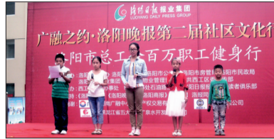
小记者口才班学员和老师同台主持活动

班。其间将安排学员与著名主持人同台主持,并有机会登报。加入小记者口才班,未来的“金话筒”就是你!