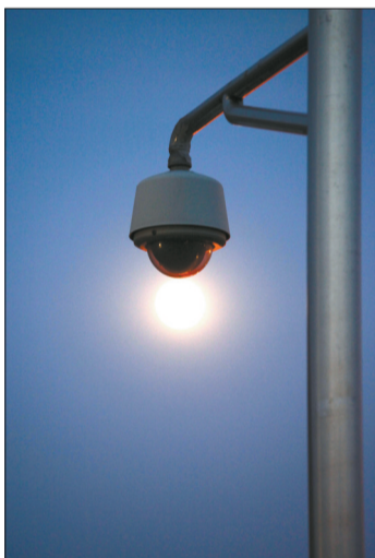
娇艳欲滴