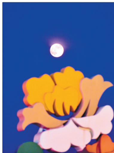
花灯映华光