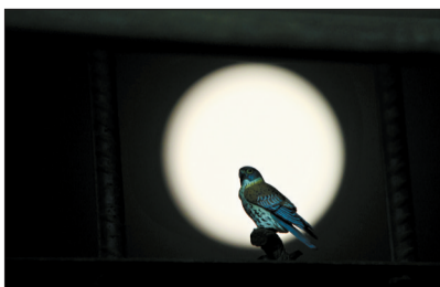
明月别枝惊“鹤”