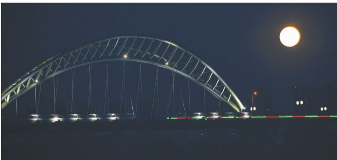
桥上生明月