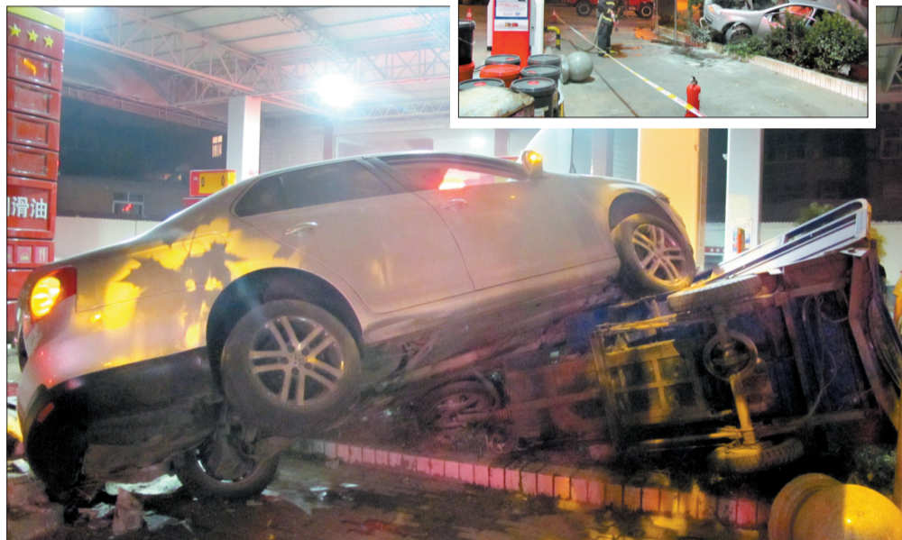
速腾轿车撞翻停在路边的三轮车后终于停了下来