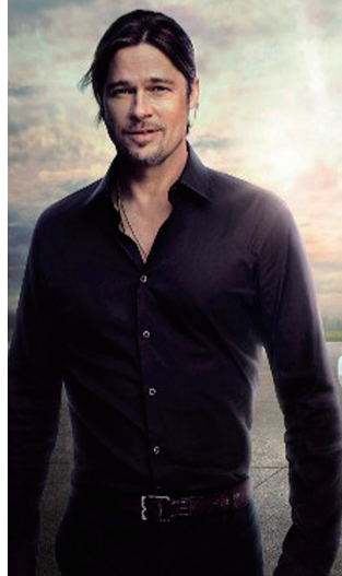
Brad Pitt 布拉德·皮特

凯迪拉克豪华轿车XTS 0利率 0月供 0担保 34.99万起 德美系中高级豪华车价值新标杆