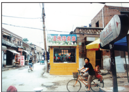
旧貌图片拍摄于2011年6月