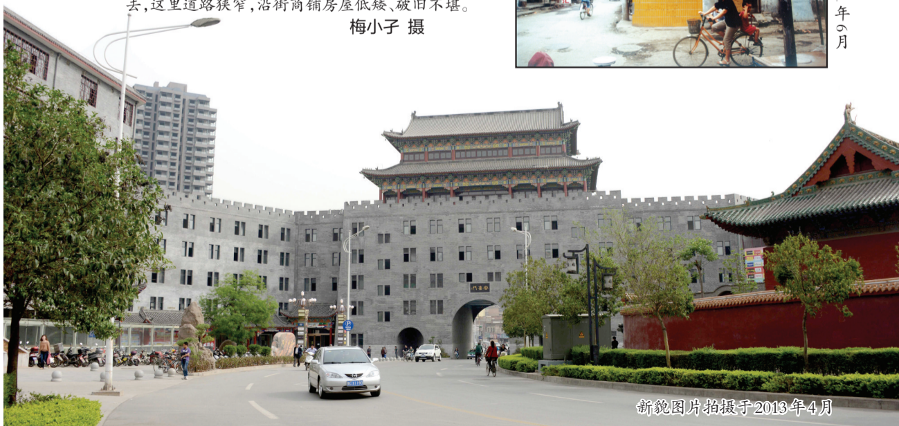
新貌图片拍摄于2013年4月