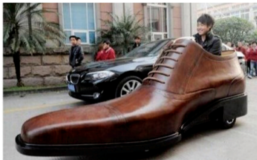
这是我的汽车 水果也疯狂