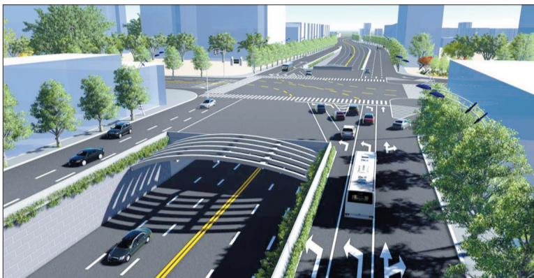
九都路解放路路口效果图

备受瞩目的九都路改造提升工程又有新动向!昨日,记者从该项目建设指挥部获悉,10月2日晚,九都路改造提升工程将全面启动,届时全线快车道将封闭施工,洛阳晚报记者为您打探了绕行方案和公交车乘车线路。