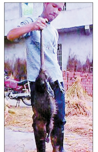
被打死的老鼠王