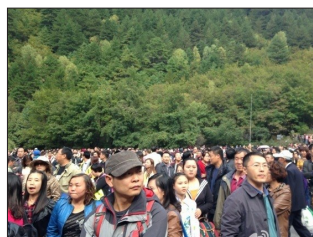
九寨沟景区发生游客滞留事件

2日,九寨沟景区发生大规模游客滞留事件。因不满长时间候车,部分游客围堵景区接送车辆,导致上下山通道陷入瘫痪。滞留数小时的游客纷纷抱怨,拥堵是管理不当所致。而景区方面则回应称,拥堵原因是少部分游客不听劝阻,拦车阻碍交通。