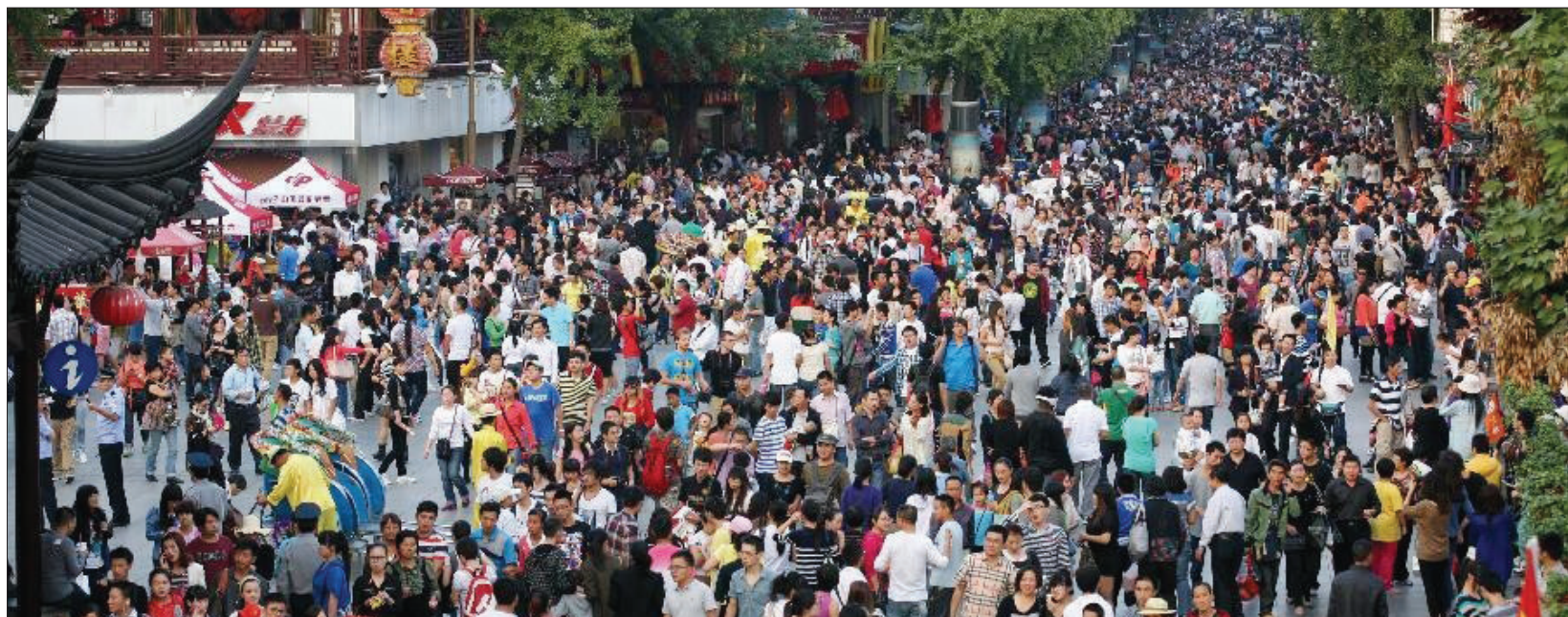
黄金周期间各大景区游客爆棚