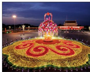
天安门广场上的花坛

在中央狠刹“四风”、厉行节约的大背景下,今年的国庆节,从节日装扮“瘦身”到晚会压缩,再到高端会务宴请遇冷,节俭、祥和之风劲吹。