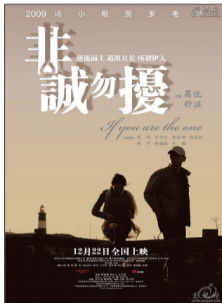
一部电影对一座城市(一个景点)的影响力可能超出人们的想象