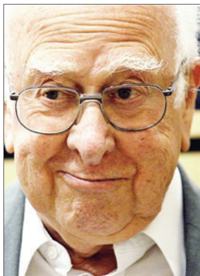
彼得·希格斯