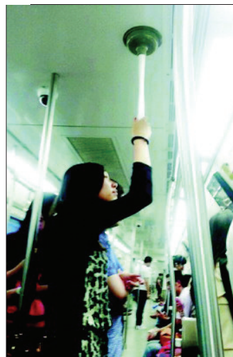
@悠悠:乘坐地铁的秘密武器……