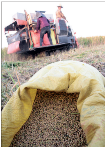
收割下来的稻谷“躺”在地里