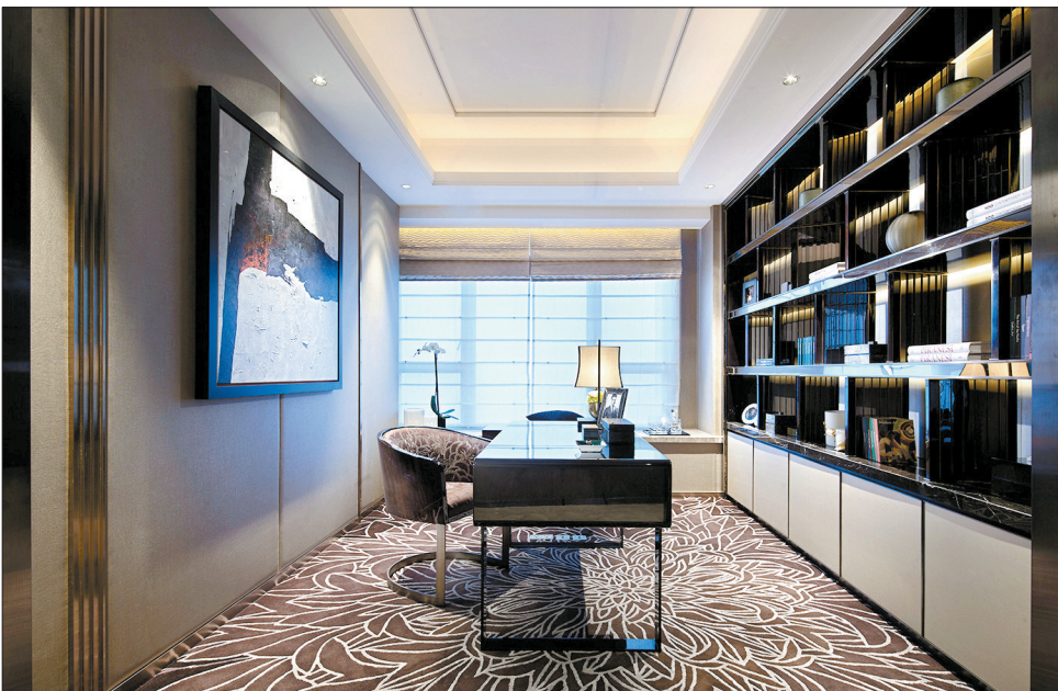
书房效果图

没错,您猜对了,如此有辨识度,体现产品细节的广告语,当然来自建业·桂园。这个被多重稀缺生态资源围绕的楼盘,牺牲了一部分规划范围内的容积率,只为了将这个系列产品中的“开山之作”打磨得更具有灵性,更适合您升级后的新版本生活。