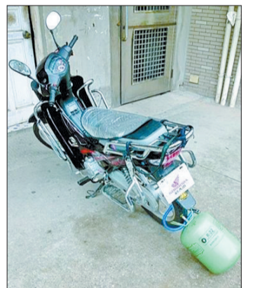
@辽沈晚报:如此防盗有点儿猛……