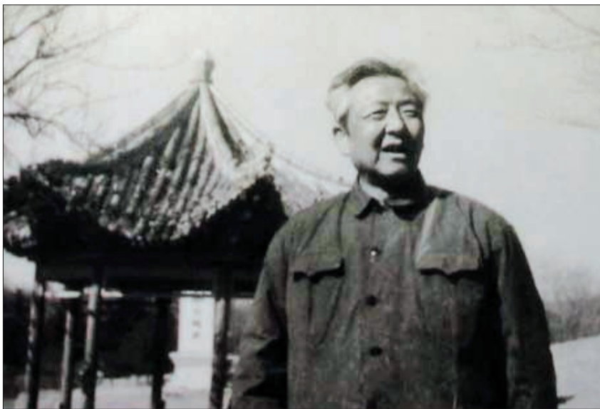
1975年,习仲勋在洛阳 (资料图片)

4 总理逝世他痛哭失声,处江湖之远仍心系国事“文革”后不久,他便表达了希望重为国家尽力的心愿