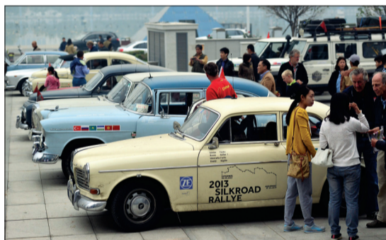
老爷车车队排列整齐

在洛阳短暂停留期间，他们将前往龙门石窟、丽景门等地，感受丝绸之路东方起点的历史文化。随后，他们将前往开封、苏州、南京，最后一站抵达上海，并从那里返程。