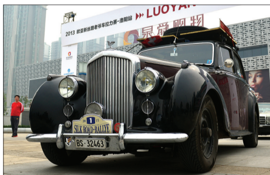
车队最古老的车——1947年的宾利