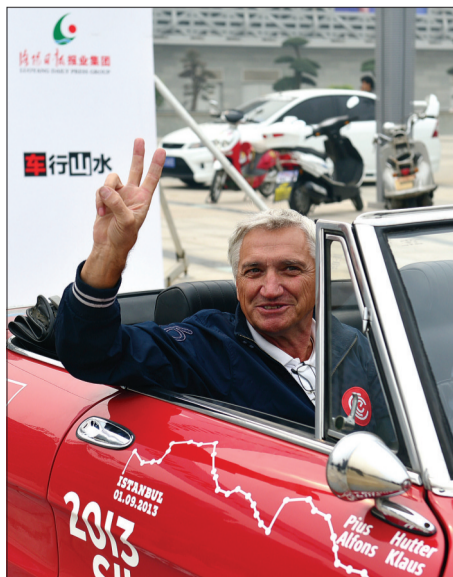
老外开心地做出「胜利」手势