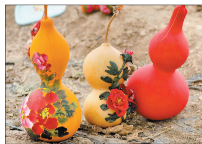
把卖相不好的葫芦涂上颜色,再进行创作