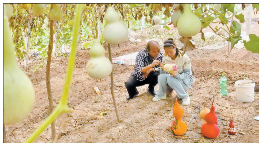
受其感染,孙女也喜欢在葫芦上作画