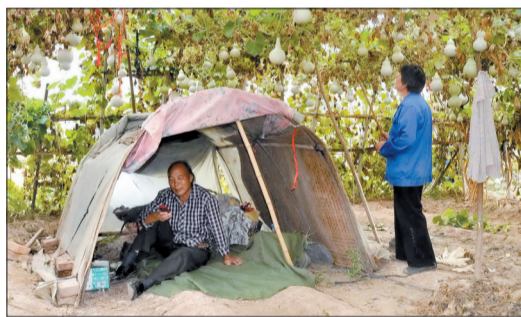
在葫芦地里搭个帐篷,干累了就进去休息一会儿