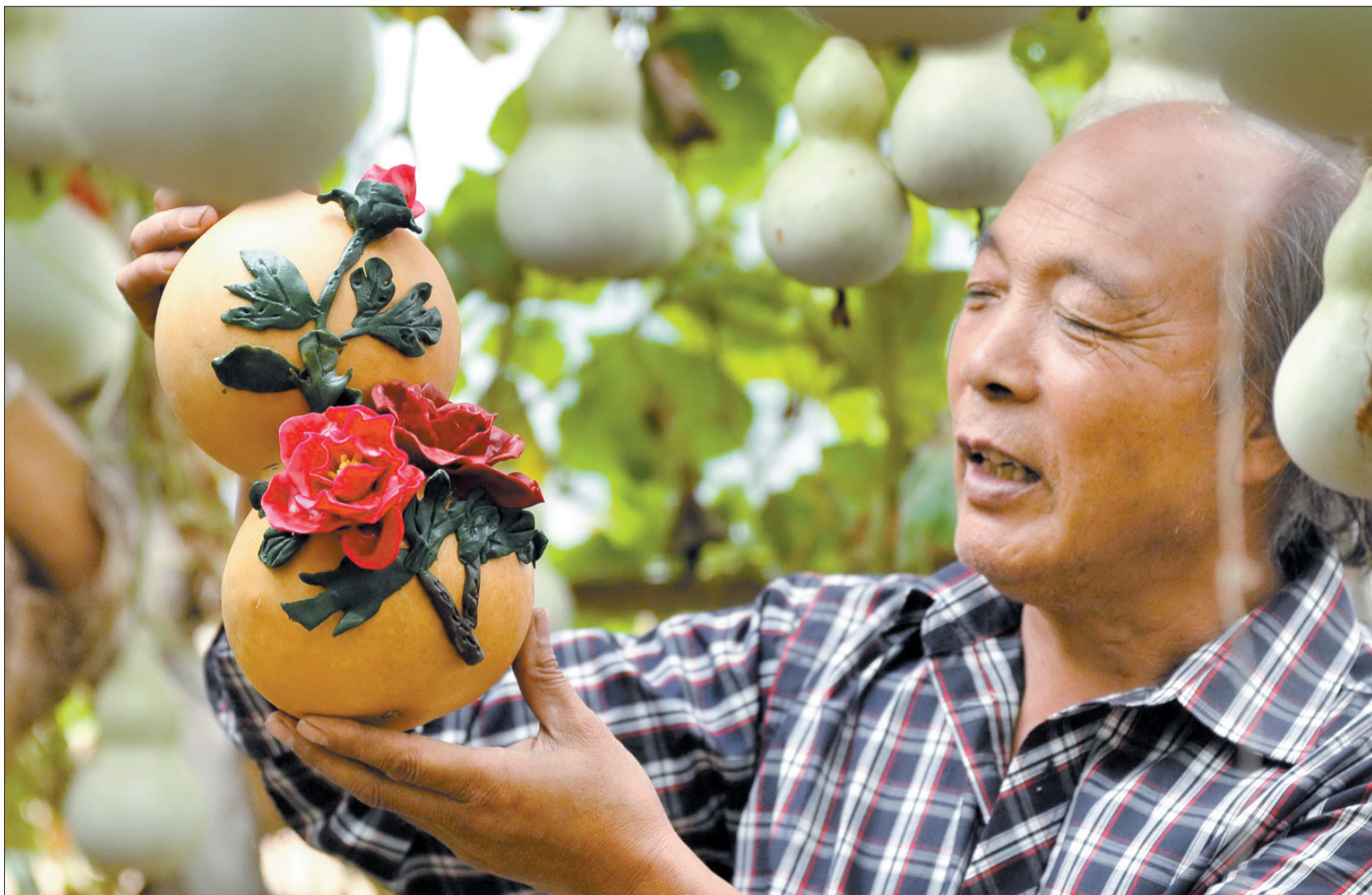
把面塑技艺移植到葫芦上