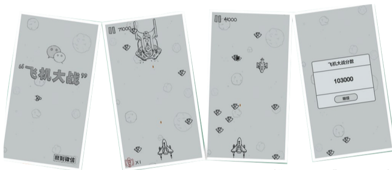
(“飞机大战”游戏截图)

《洛阳晚报》微信“飞机大战”争霸赛报名将于10月25日截止,10月26日、11月2日分两次进行初赛海选。初赛完毕后,选手们可提前尝鲜“体感游戏”,免费畅玩,为复赛热身。微信“飞机大战”有技巧,跟您分享4招,让您更添信心问鼎冠军。