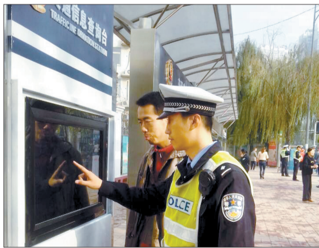
交警向市民介绍这一信息查询台的使用