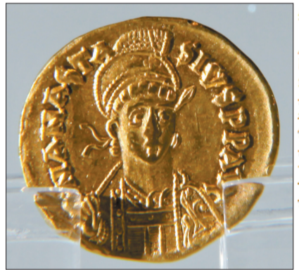
拜占庭阿纳斯塔修斯一世金币

墓的发掘工作已基本结束,出土的阿纳斯塔修斯一世金币国内罕见,有力证明洛阳是丝绸之路东方起点