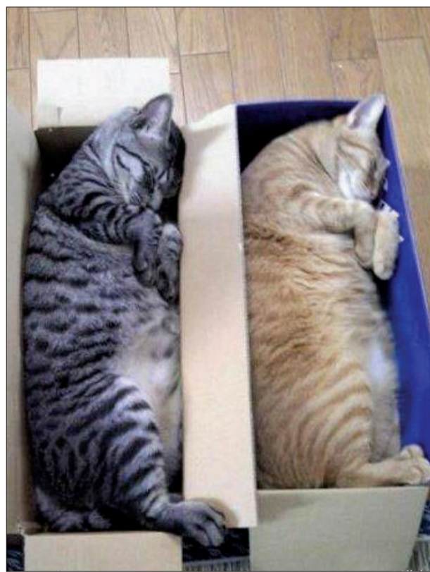
▲ 我们对床的要求不高